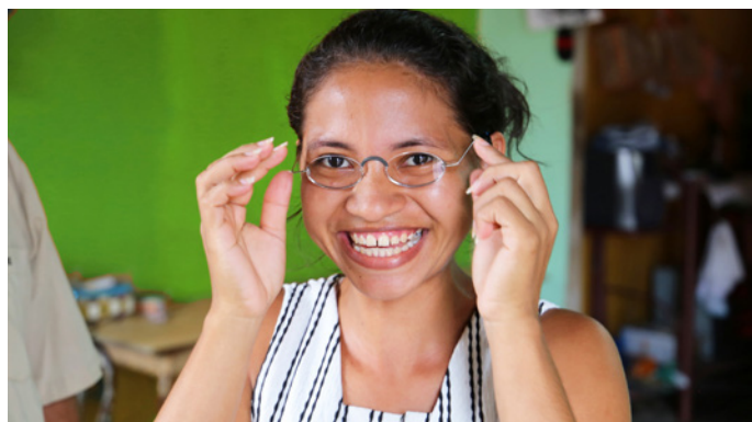
Stilvoll und erschwinglich: die EinDollarBrille

Schnell: Die individuell angepasste Brille ist sofort einsatzbereit